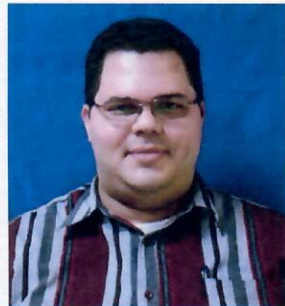
Meraiot Lendor Auditor Dpto. Certificación de Productos